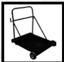
Carrito para tambos de Aceite Mod. 200A2302-1