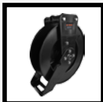
Carrete de Aceite Mod. GSI0H-400DU