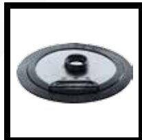
Plato Seguidor Mod. 640-19-101