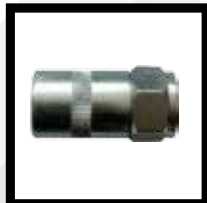
Boquilla Reforzada Mod. 1005-33R