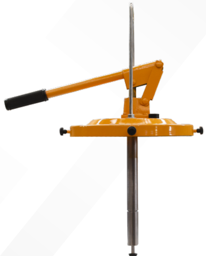
Bomba 101 con manguera de grasa