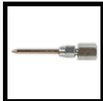
Dispensador tipo Aguja Mod. 1005-35