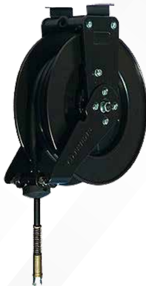
Tope de manguera retráctil