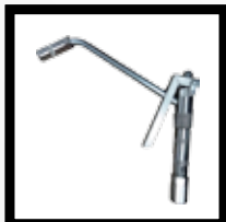
Pistola Control de Aceite Mod. 635-514