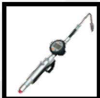
Pistola Contadora de Aceite Mod. OM/200/OGN/FB-AN